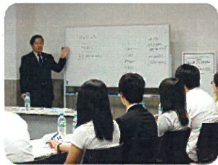
「第1回就活スキルアップセミナー」風景